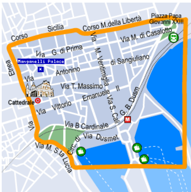
CENTRO STORICO - PORTO